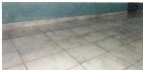
PISO COM RETRAÇÃO