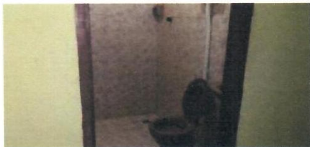
WC SALA 01