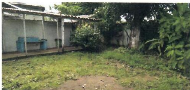
VISTA DOS FUNDOS