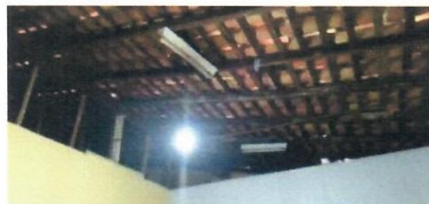
COBERTURA EM TELHA CERÂMICA