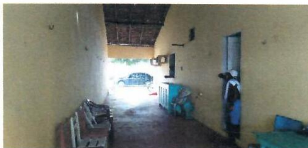
VISTA DA GARAGEM

Eliane Nascimento ENGENHEIRA CIVIL CREA 150422649 - 6