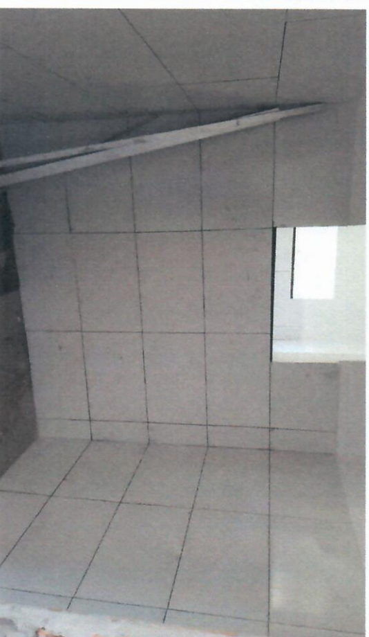
IMAGEM 004 E 005: CONCLUSÃO DA INSTALAÇÃO DOS REVESTIMENTOS DE PAREDE NO BLOCO 02;