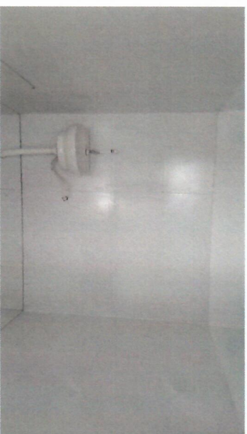
IMAGEM 006 E 007: INSTALAÇÃO DAS LOUÇAS SANITÁRIAS NO BLOCO 02;