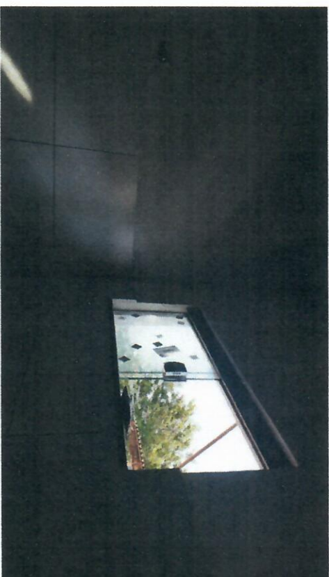
IMAGEM 008: INSTALAÇÃO DE ESQUARIAS DE VIDRO NO BLOCO 02

OBJETO: SERVIÇOS DE OBRAS DE ENGENHARIA PARA REFORMA DA UNIDADE MISTA DE SAÚDE – UMS, DO MUNICÍPIO DE COLARES/PA.