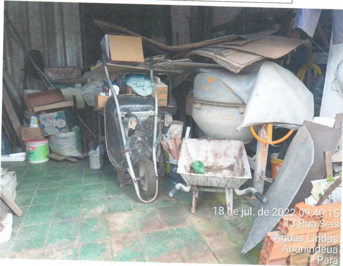
FOTO 10- DEPOSITO