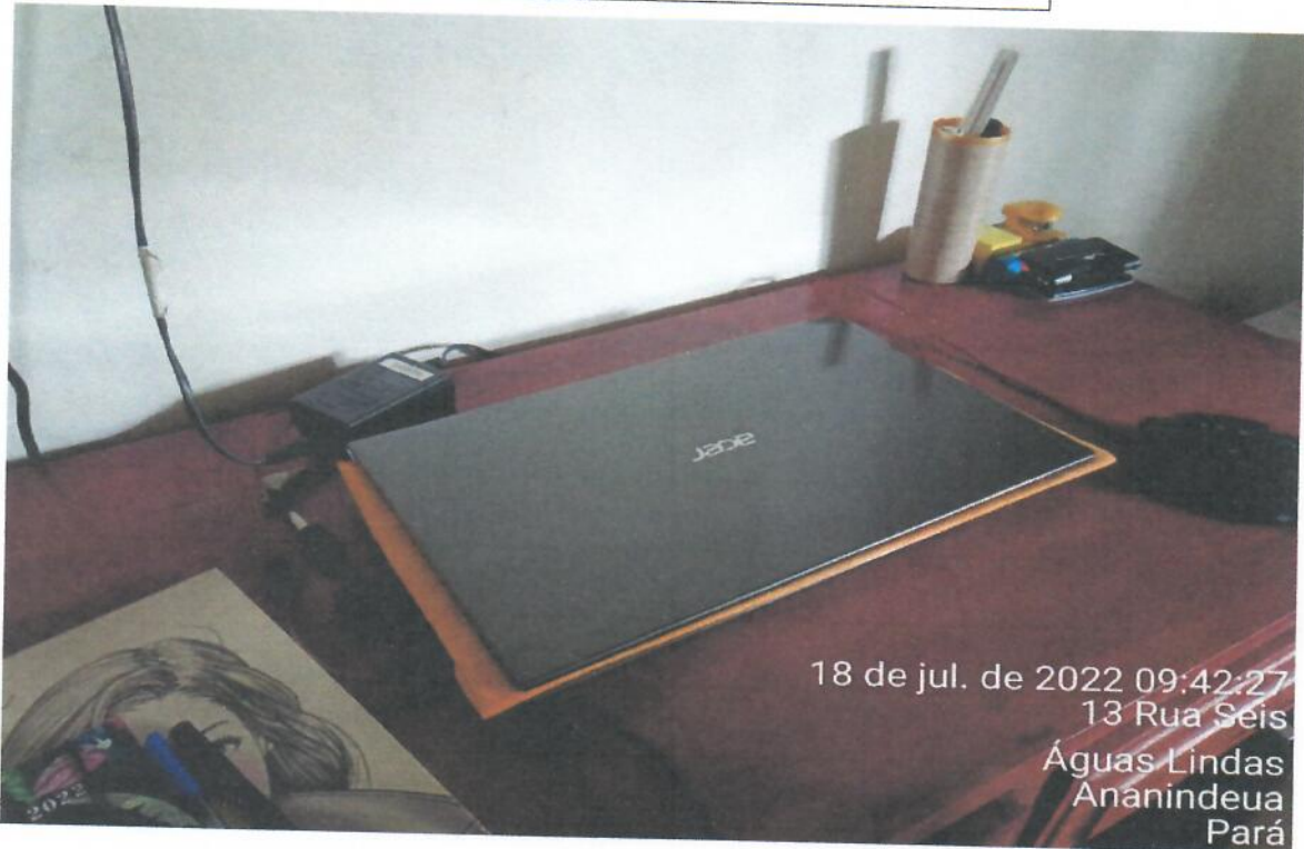
FOTO 06- ADMINISTRATIVO